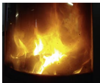
Die Drosselklappe kann geschlossen werden