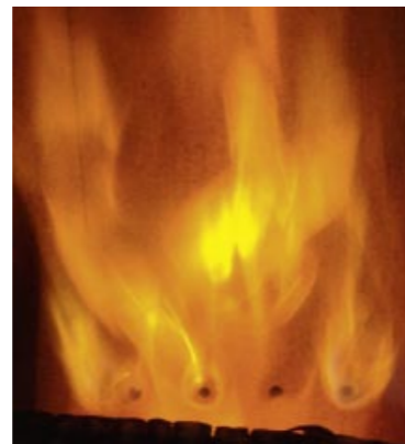
Tertiärluft wird durch Düsen im hinteren Brennbereich „eingebblasen“

Zusätzlich oder parallel zur Sekundärluft wird den Brennräumen mancher Öfen noch Tertiärluft durch spezielle Düsen im hinteren Brennbereich zugeführt. Dies dient einer weiteren Verbesserung der Vermischung von Brenngas und Luft in der Vollbrandphase.