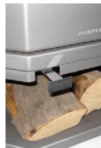
Die Luftschieberstellungen entnehmen Sie Ihrer Bedienungsanleitung

Bei den klassischen handbeschickten Kaminöfen unterscheidet man zunächst zwischen der Primärluft, die von unten durch den Ascherost dem Verbrennungsgut zugeführt wird, und der Sekundärluft beziehungsweise Tertiärluft, die von oben oder hinten zugeführt wird. Die Luftschieber steuern die jeweilige Verbrennungsluftmenge. Die Primärluft wird insbesondere zum Anzünden benötigt. In der Vollbrandphase sollte sie möglichst weit geschlossen werden. Auch zur Verbrennung von Braunkohlebriketts wird verstärkt Primärluft benötigt. Wie die einzelnen Luftschieber für eine optimale Verbrennung zu betätigen sind, entnehmen Sie bitte der Bedienungsanleitung Ihres Geräts!