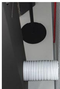
Anschluss der externen Verbrennungsluft mittels Aluminium-Flexrohr

Insbesondere bei Häusern in moderner Bauweise (mit luftdichter Hülle) und bei Häusern mit kontrollierter Wohnraumlüftung ist es ratsam, der Feuerstätte die Verbrennungsluft von außen über einen Luftkanal direkt zuzuführen.