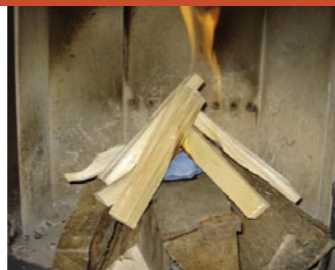
Anzünden mit oberem Abbrand