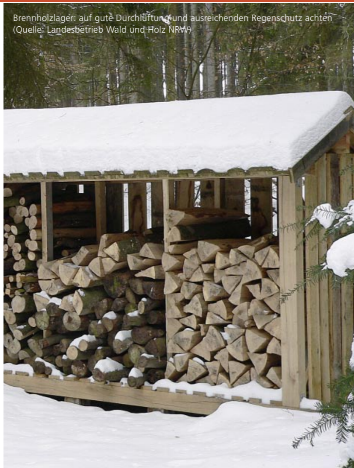
Brennholzlager: auf gute Durchlüftung und ausreichenden Regenschutz achten

Durch das Verbrennen von nicht ausreichend getrocknetem Holz kommt es in der Praxis immer wieder zu Störungen im Kaminofenbetrieb, und auch „alte Hasen“ wundern sich, warum in der neuen Heizsaison die Kaminofenscheibe plötzlich stärker verrußt oder dass sich Rauchrohr und der Schornstein frühzeitig mit einer dicken Rußschicht überziehen. Diese Symptome sind typisch für das Verheizen von schlecht getrocknetem Holz . Auch wenn dieses sich äußerlich trocken anfühlt und Trocknungsrisse aufweist, kann die Restfeuchte im Innern noch recht hoch sein.