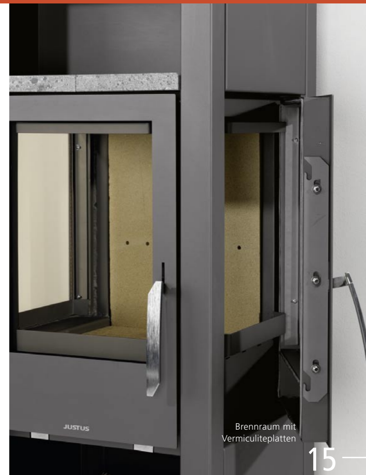
Brennraum mit Vermiculiteplatten

Gerissene Vermiculiteplatten brauchen zunächst nicht ersetzt werden – erst wenn der darunterliegende Metallkorpus frei liegt, muss getauscht werden. Vermiculiteplatten sind asbestfrei und ungiftig.